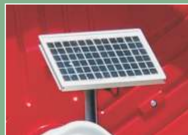
Placa Solar para recarga de bateria