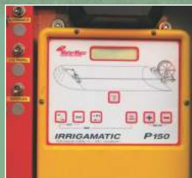
Painel eletrônico de controle de velocidade